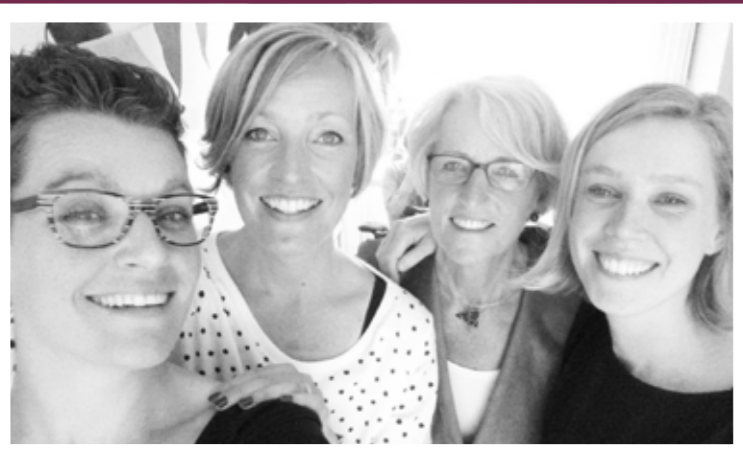
"Met mijn moeder en zusjes. Ik ben zo blij met ze!"