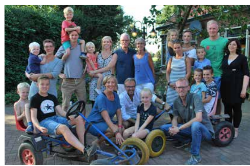
"Mijn heerlijke, grote familie, tijdens de 45-jarige bruiloft van mijn ouders."